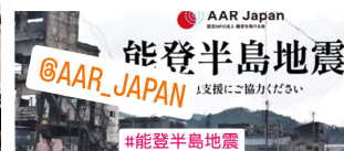
能登半島地震募金