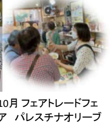
10月 フェアトレードフェア パレスチナオリーブ製品の試食