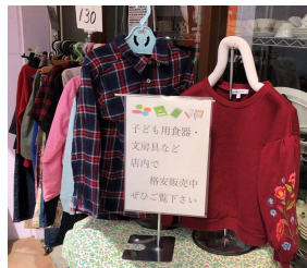
9月 子ども服お下がり交換会