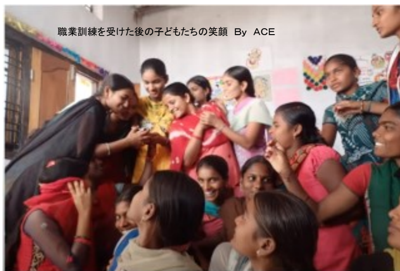
職業訓練を受けた後の子どもたちの笑顔